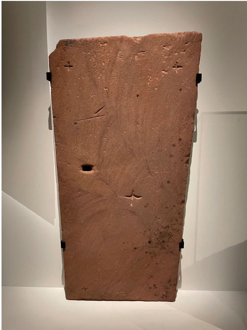
De 12-eeuwse Langezwaags altaarsteen. Afmetingen: 160 tot 148 cm lang en 71 tot 84 cm breed. Soort steen: zandsteen

Bij de foto op de voorzijde: In de tentdienst van 7 september mochten we weer Dodo van Haska en broeder Isidorus begroeten, twee goede oude bekenden.