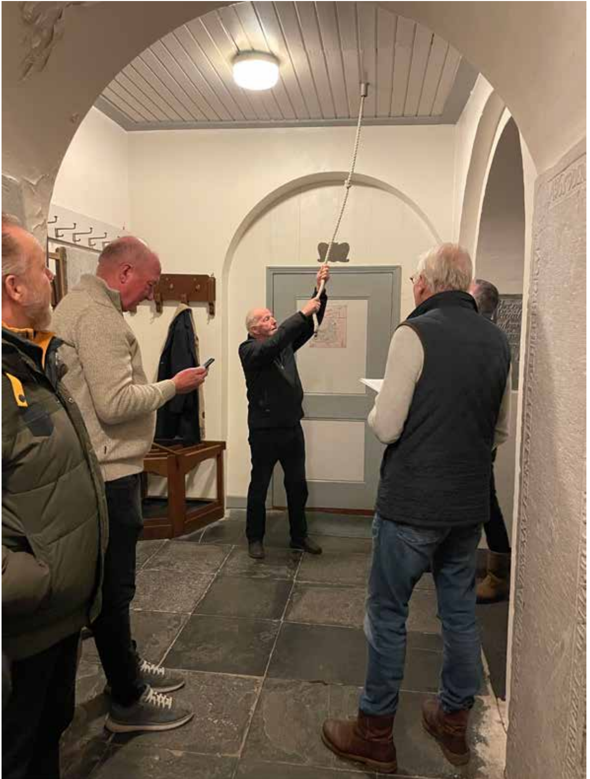
Op zondagavond 2 februari werd de klok van de Mattheütsjerke geluid, ter herinnering aan de Vergeten Watersnood uit 1825